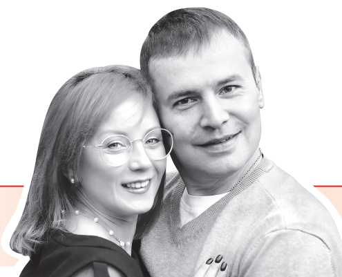
СЕМЬЯ, РОДИТЕЛИ ЧЕТЫРЕХ ДЕТЕЙ